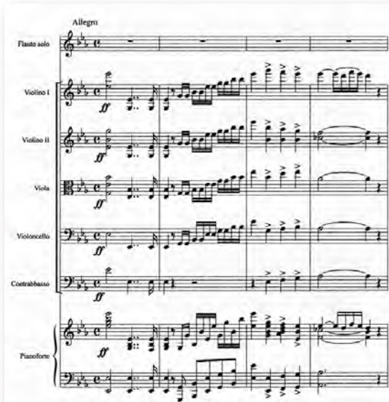
Fragmento del concierto n° 2, guardado en el Conservatorio "G. Verdi" de Milán.